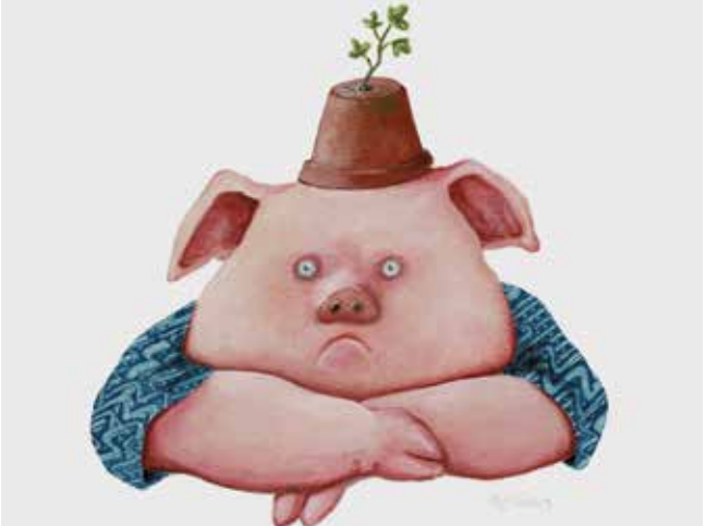
Trägt Herr S. den Tontopfhut Wird die Bohnenernte gut.

Mitte April bis Ende Oktober 2024 ganztäglich